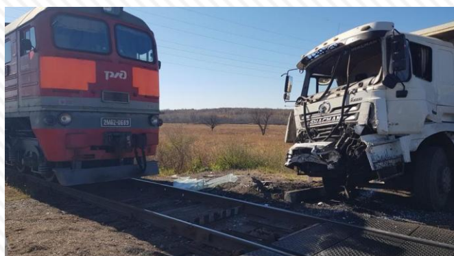
7 октября 2022 г. перегон Буряя - Амурская