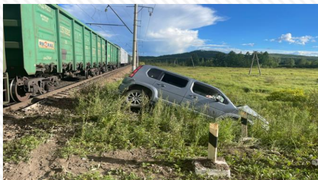
7 августа 2022 г. перегон Бушулей – Жирекен