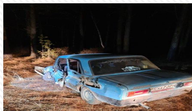
24 октября 2022 г. перегон Усть Пера - Ледяная