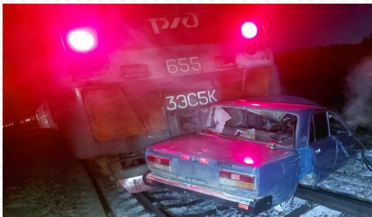
16 января 2022 г. станция Сбега