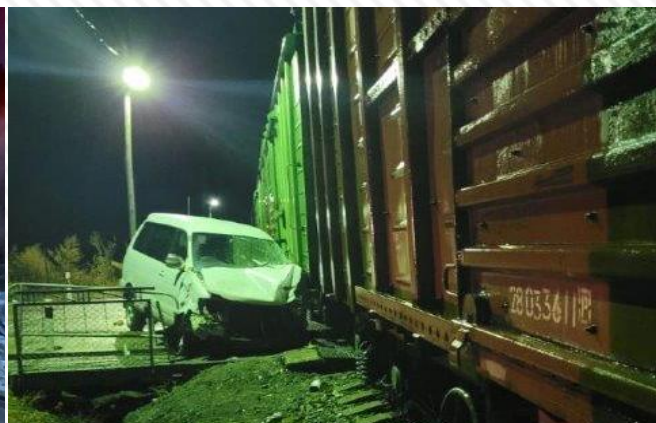
10 апреля 2022 г. станция Моховая Падь