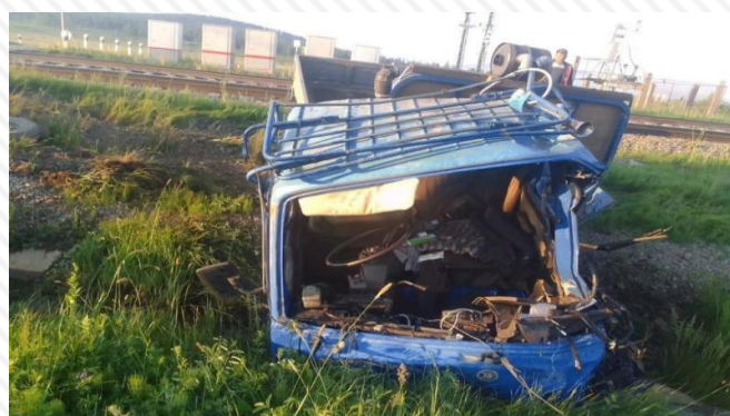
28 июня 2022 г. перегон Тайдут – Могзон