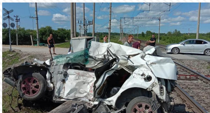
20 июля 2022 г. перегон Украина – Белогорск